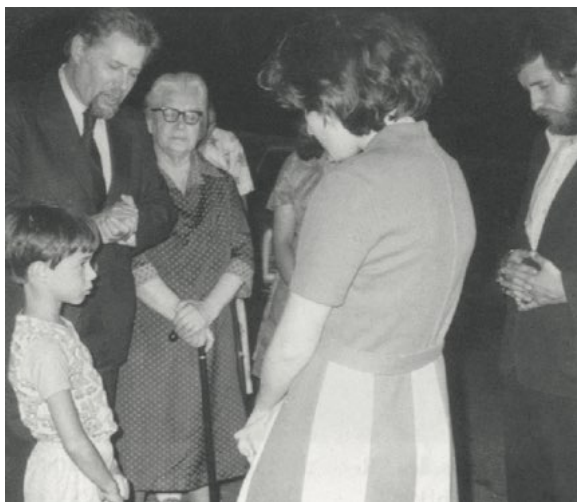
Папа совершает молитву в первые минуты встречи с семьей