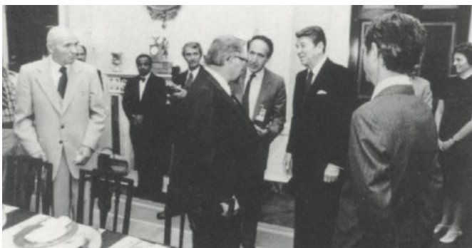
Г.П.Винс в Белом Доме во время встречи с президентом Р.Рейганом, 1982 г.