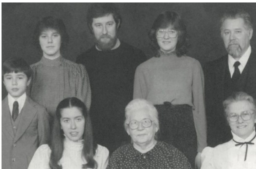
Семья Винс в Элкарте, США, 1981 г.