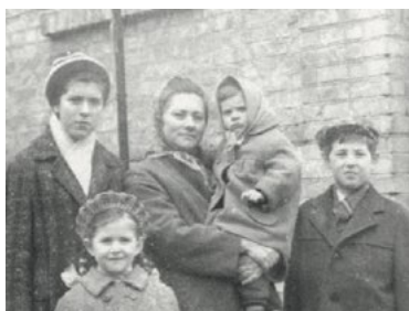
Перед поездкой к папе в лагерь на Северный Урал, 1968 г.