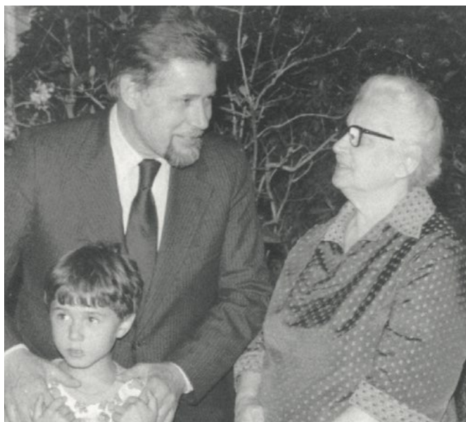
Долгожданная встреча: папа с бабушкой и Шурой. Вермонт, США, 14 июня 1979 г.