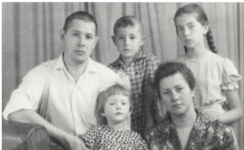
Наша семья в 1963 году, после того, как папа отсидел 15 суток.