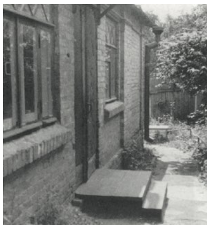
Наш дом на Сошенко