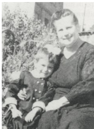
Бабушка с «дочкой-внучкой»