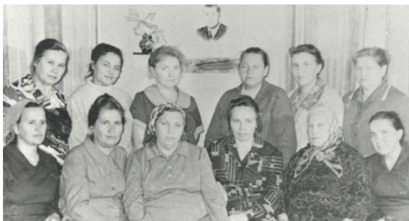
Совещание Совета родственников узников, проходившее в нашем доме, 1979 г.