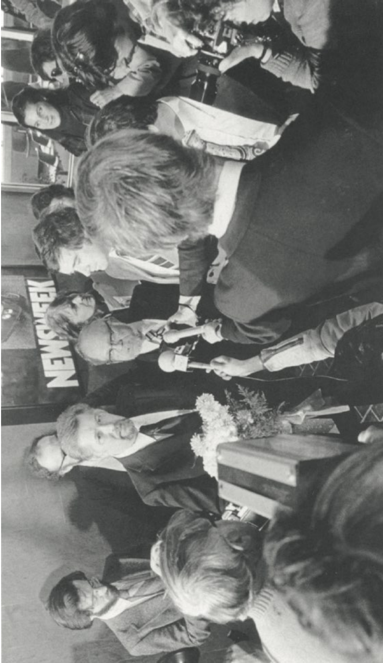
Пресс-конференция в Нью-Йорке, 28 апреля 1979 г, на следующий день после освобождения