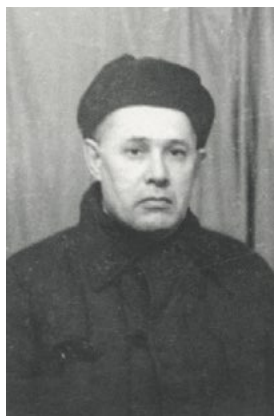
Папа в лагере в тю- ремной форме