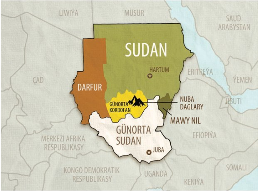
Sudanyň uruş zonalaryny görkezýän karta.